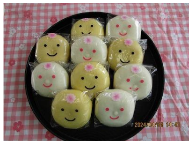
ミルクorカスタード饅頭