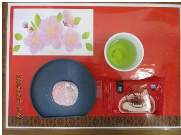
ホイップクリーム大福