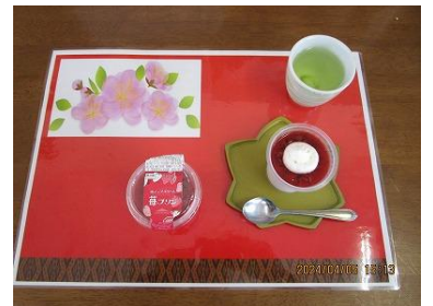
ホイップクリーム苺プリン