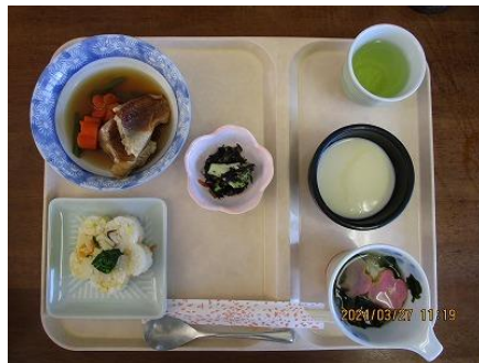
春の炊き込みごはん